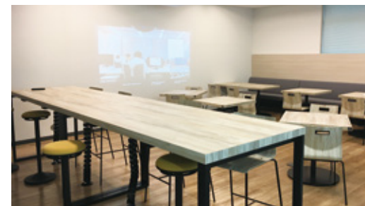
コーヒーを片手に、ゆったりとした時間を過ごせる安らぎの空間リフレッシュコーナー