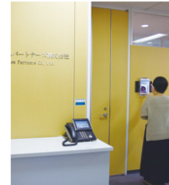
エントランスは、顔認証システムで入室管理