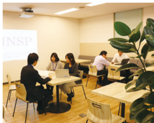
様々な目的に利用するリフレッシュコーナー

業務の面では、顧客の既存ビジネスの記録を主体とした「System of Records (SoR)」から、つながりによって新たな価値を生み出す「System of Engagement (SoE)」に挑戦していきたいと考えています。