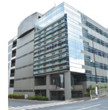
本社 豊洲駅から徒歩8分